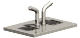
Optinen annostelija W-O-2

Festivo Buffet Line kylmävesijakelimet on tarkoitettu juomaveden jäähdyttämiseen ja annosteluun. Vesijakelimissa on kylmäkoneisto ja lasilla painettava annosteluhana (T). Jakelimiin saa myös optisen hanan (O), jolloin lasi asetetaan alustalle ja venttiili aukeaa automaattisesti. Venttiilin aukiolajan voi säätää lasin koon mukaan. Annosteluhanan alla on irrotettava juomalasialusta ja viemäroity veden keräilyastia.